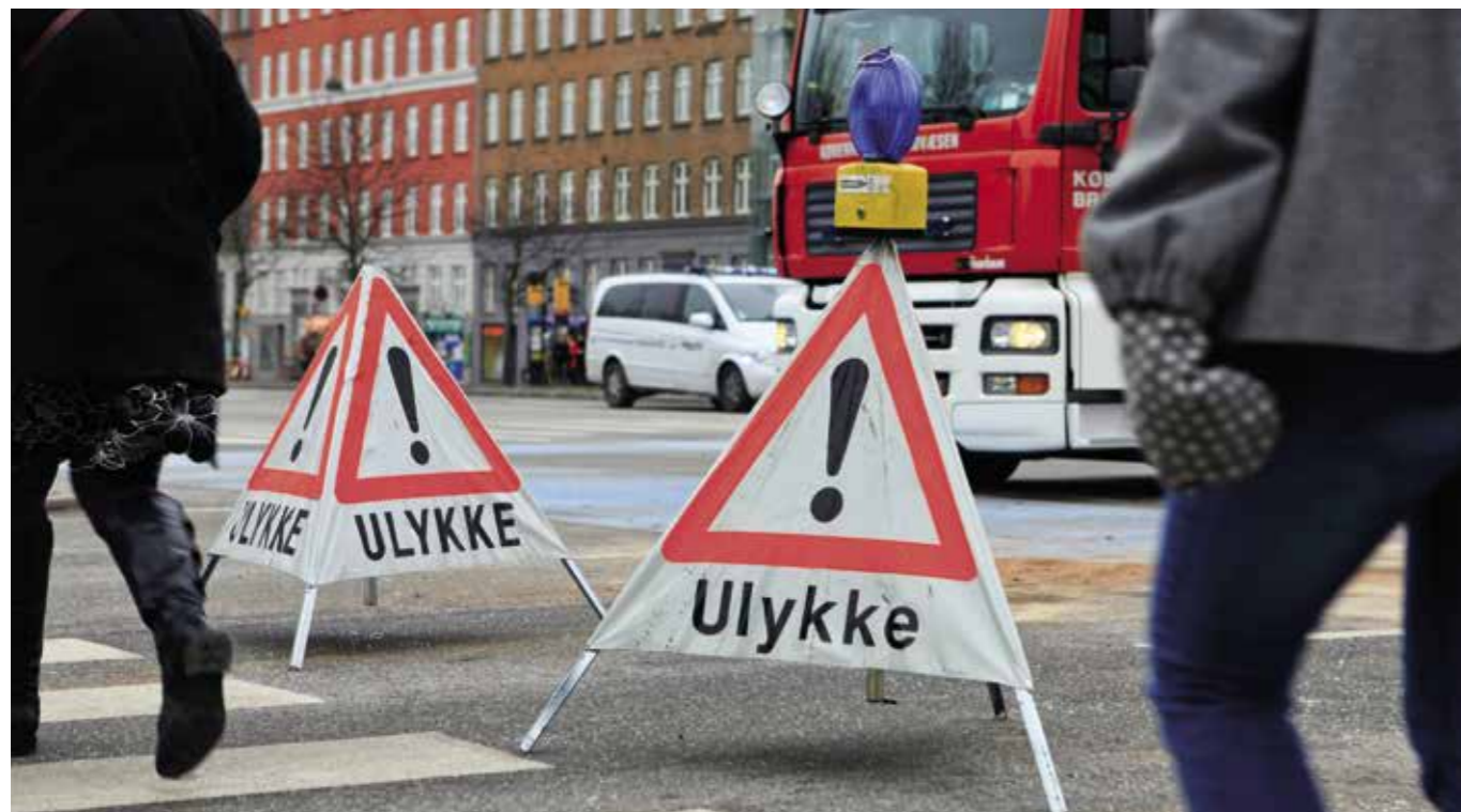
Besparelser giver ikke bedre kvalitet. Hvis ulykken er ude, skal kvaliteten være i top.