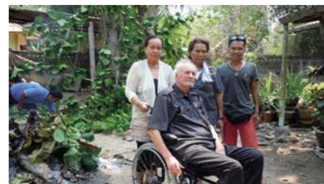
Oles familie i Thailand