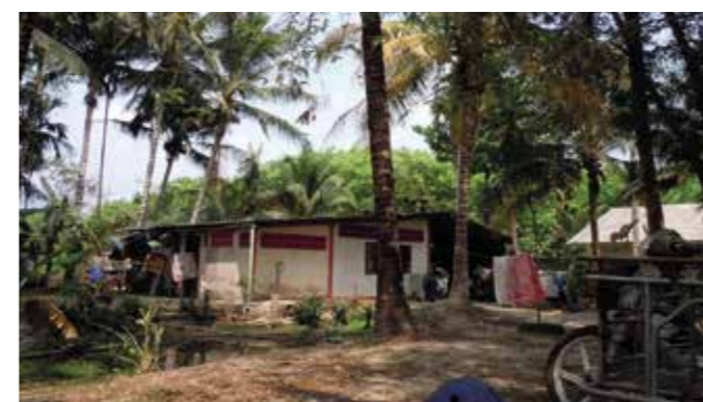
Oles hus i Thailand