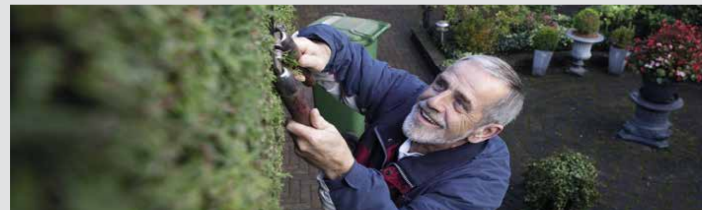
Vil du gerne have mere tid til haven eller andre spændende ting, så kan du måske gå ned i tid og supplere med efterløn.

Vores klare anbefaling er derfor, at bestyrelsen i Hovedstadens Beredskab annullerer en dyr og usikkerhedsskabende markedsafprøvning