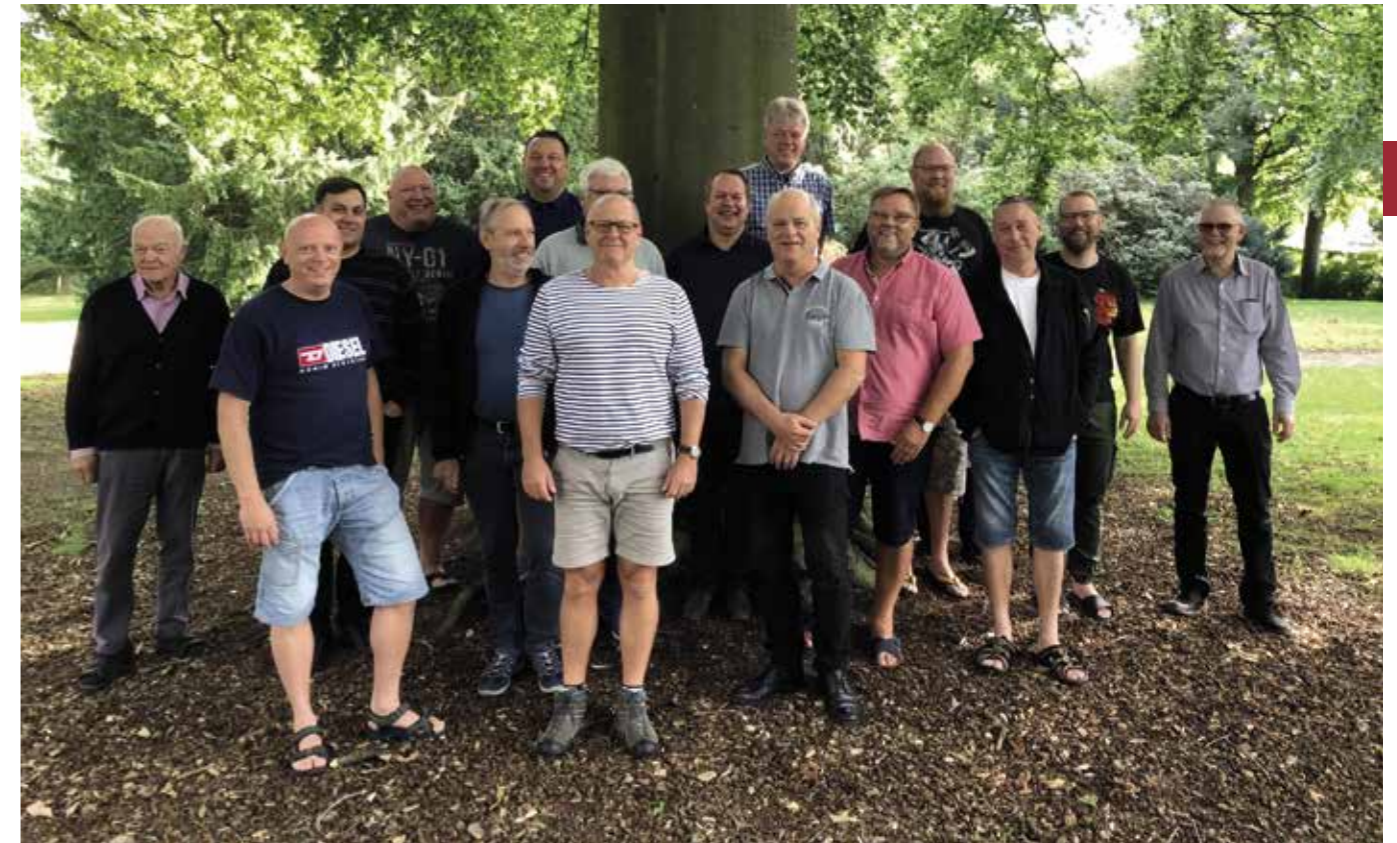
Billede fra repræsentantskabsseminaret september 2018.