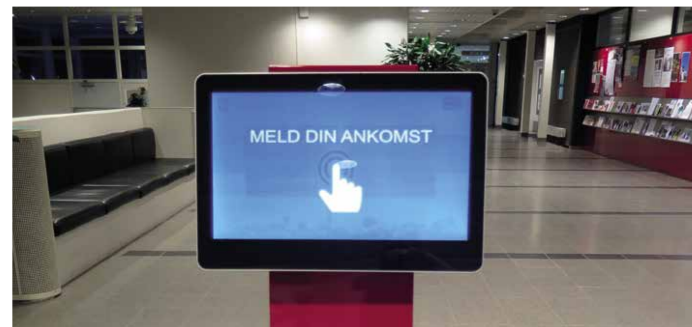
Om aftenen og natten er Rådhuset lukket af, og kontakten til borgerne sker via telefon. Om dagen er der masser af liv, når borgerne melder deres ankomst i receptionen hos Claus