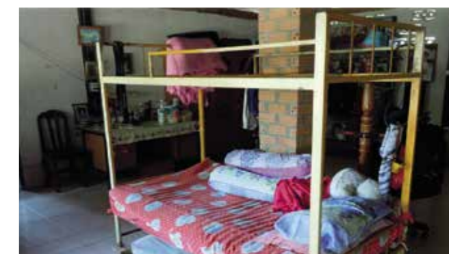
Oles nye seng i Thailand