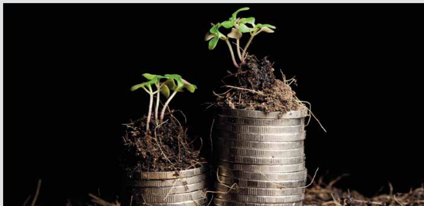
Gå ned i tid - og suppler din indkomst med efterløn.